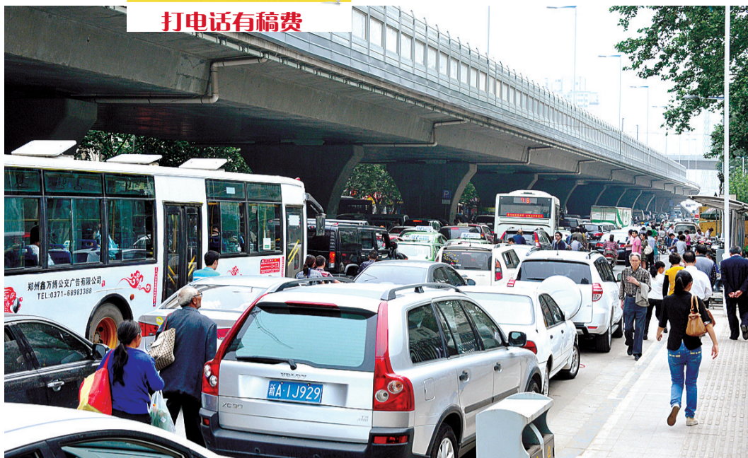
郑大一附院北门口建设路上,车辆在路边停放了兩排。

郑州晚报“挑刺”行动正在进行,郑州晚报热线96678及新浪微博将与市民形成互动。