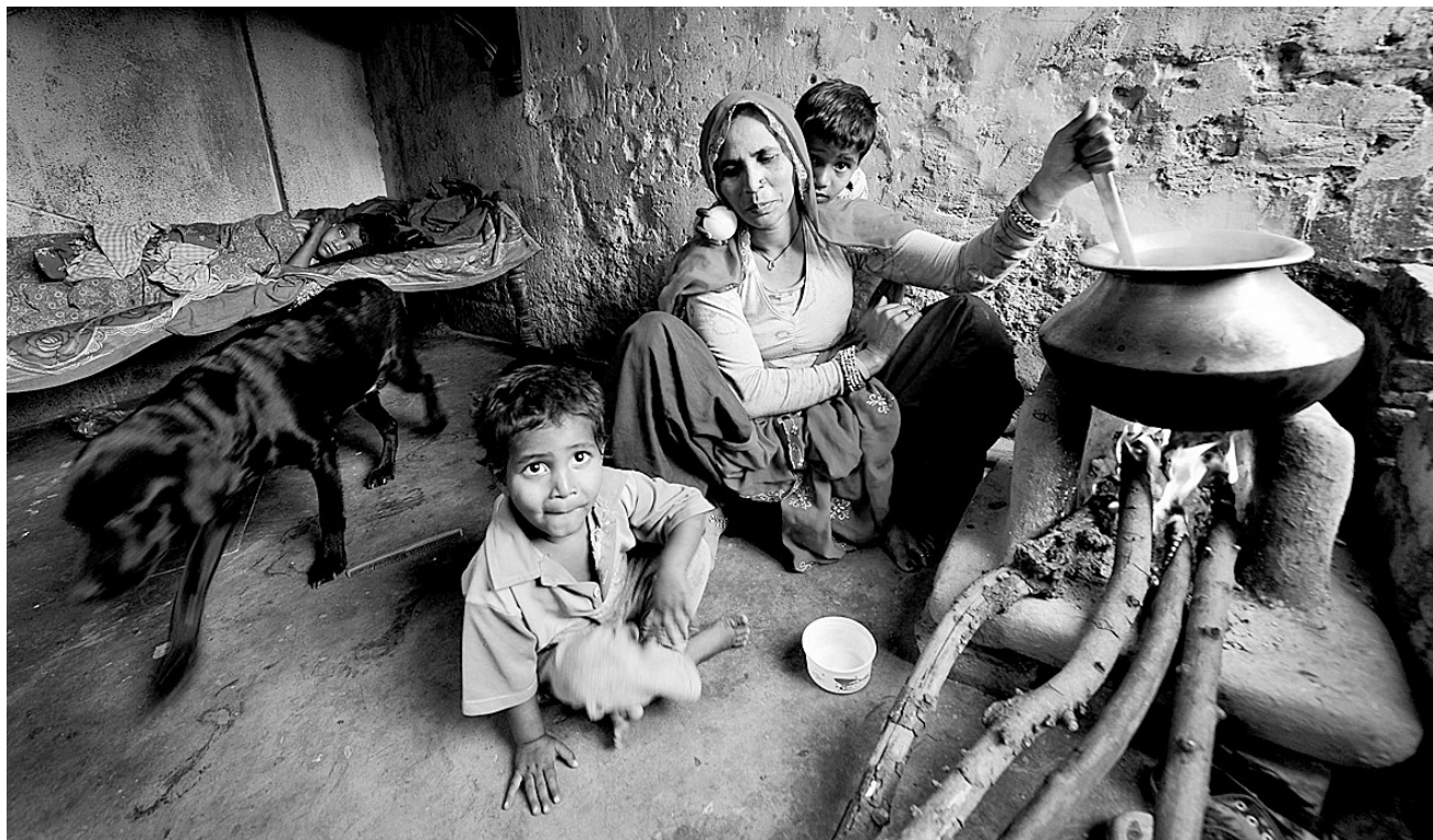
位于印度新德里南部的一处贫民窟内，一名妇女和她的几个孩子在屋内做饭。这间屋子既是卧室，又是厨房和厕所。