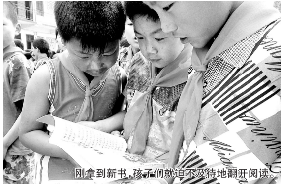
刚拿到新书,孩子们就迫不及待地翻阅阅读。

收到风扇,孩子说“今年夏天,我们的教室就变凉快啦” 您想参与到帮助孩子们的爱心队伍中吗,请联系我们