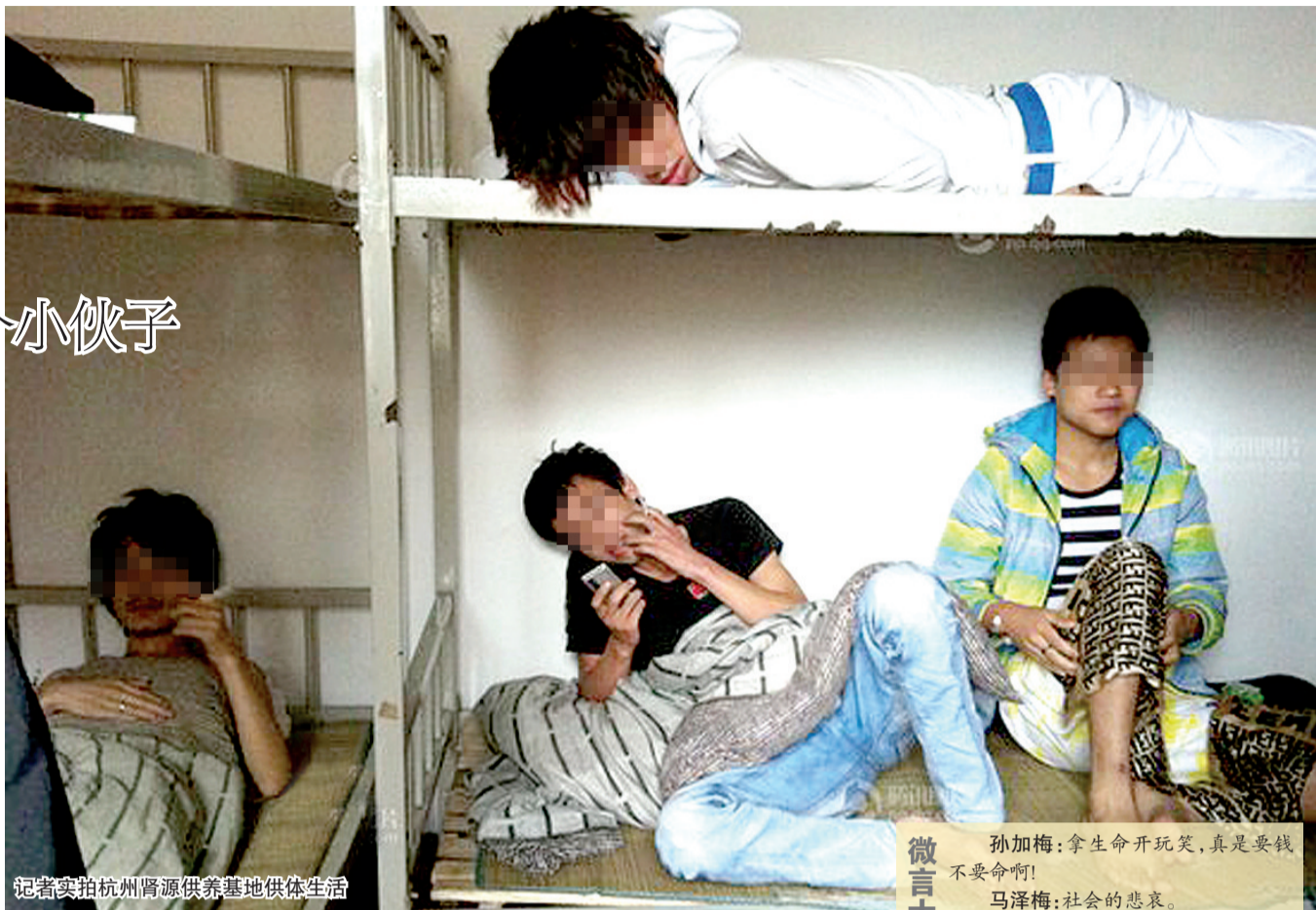
记者实拍杭州肾源供养基地供体生活

据媒体报道,杭州一小区内存在一个非法肾源供养基地。住在“卖肾基地”中的都是年轻男子,卖肾的原因有还债、嫌打工赚钱慢等。报道称,该基地内目前有30余名供体,一颗肾国内统一行价3.5万元。记者5月28日获悉,杭州警方目前已介入调查。