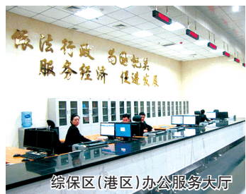
综保区(港区)办公服务大厅

加快新型城镇化建设。以产业集聚区、城市组团起步区、中心城区功能提升、合村并城、生态廊道、市场快速通道及“二环十五放射”道路绿化提升等六项工作作为切入点,推进新型城镇化建设,打造中原经济区郑州都市区建设的核心增长极。