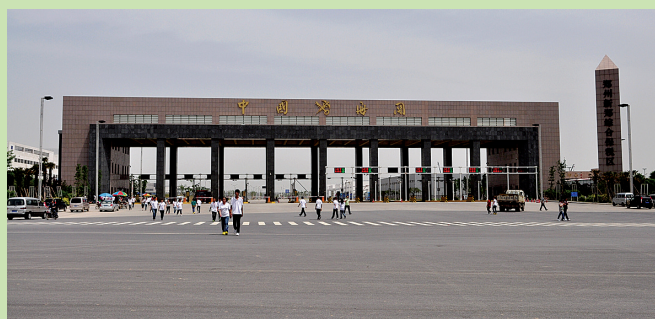
郑州新郑综保区主卡口

一个充满生机与活力的经济增长板块、一座承载百万人口的国际化航空大都市正在中原大地快速崛起。