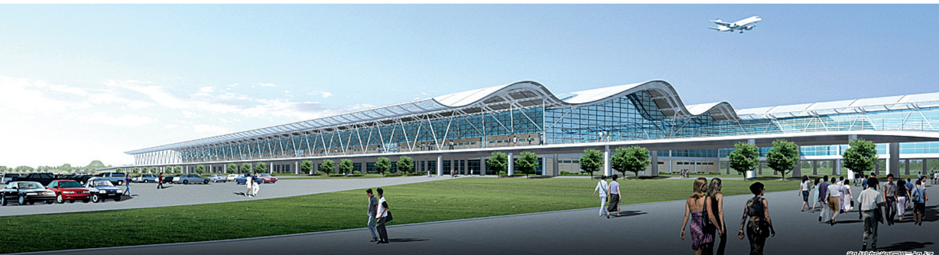
郑州新郑国际机场

郑州新郑综合保税区(郑州航空港区)在加快推进重大项目建设的同时,重点发展电子信息、生物医药、航空物流等三大产业,加快新型城镇化建设步伐,加大招商力度,经济社会呈现跨越式发展的迅猛态势。一个充满生机活力的经济增长板块、一座承载数百万人口的国际化航空城正在中原大地快速崛起。