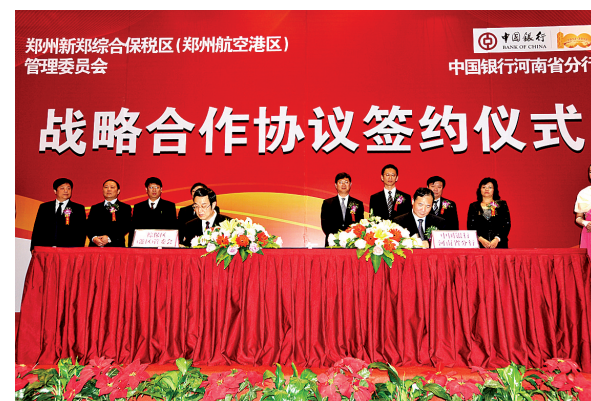
与中国银行签订战略合作协议