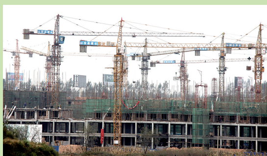
重大项目建设工地