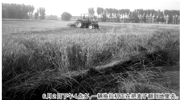
6月2日下午4点多,一辆拖拉机正在把麦子翻到地里去。