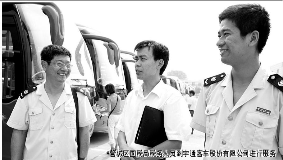
管城区国税局税务人员到宇通客车股份有限公司进行服务

通过分类、分部门、分阶段的培训学习,逐步探索并建立起税源管理专业人才能级管理制度,逐步建立起一支综合素质高、专业技能强的税源专业化管理人才队伍。并建立人才“储备库”,对相关人员定期培训,确保知识结构不断更新。