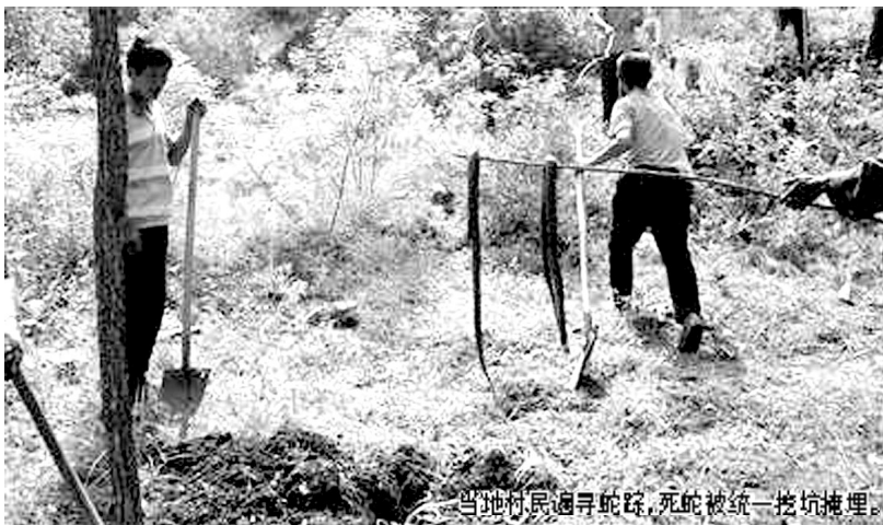
当地村民遍寻蛇踪,死蛇被统一挖坑掩埋。

直到4日上午,在京冀交界处不远的河北省兴隆县苗耳洞村,仍有数十村民在打蛇。6月1日,十余名北京游客来到该村,将数千条蛇放归野外。长蛇横行并爬进村民家中,一度在当地引起恐慌。