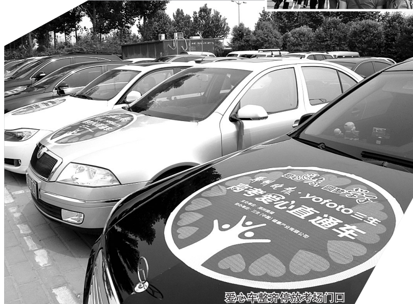
爱心车整齐停放考场门口