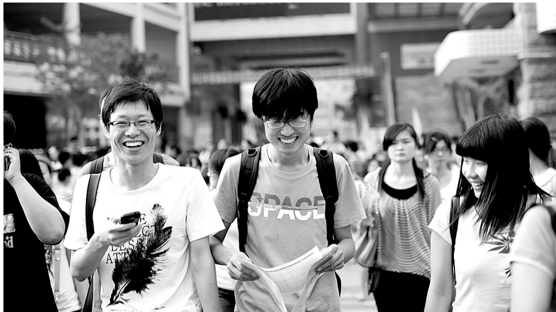
考完最后一门,考生们的心情彻底放松了。