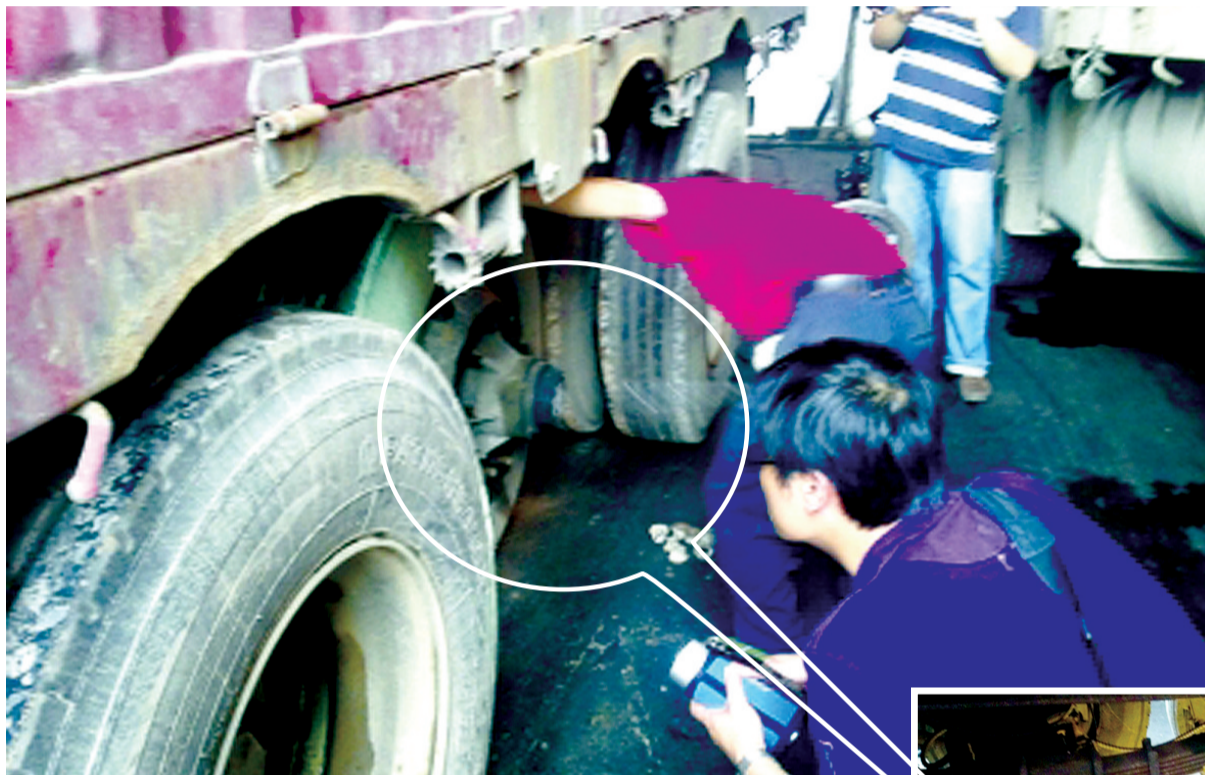
警方在检查。小图为该车轮毂部分。

那么,司机“不知情”的说法真实可靠吗?记者随后进行了了解:从时间节点上看,“最美司机”吴斌不幸身亡,最早的消息是6月1日下午近2点时,由无锡公安交警部门在官方微博“@无锡交警”上发布的,随即被大量转发。翌日,即6月2日这天全国媒体才开始大规模地报道吴斌的感人事迹。司机自称不知情,也不排除这种可能。