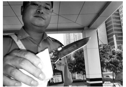
民警寻找到男子丢弃的作案刀具