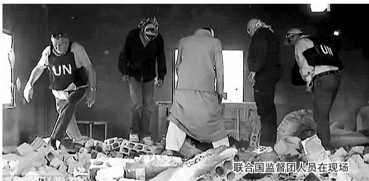
联合国监督团人员在现场