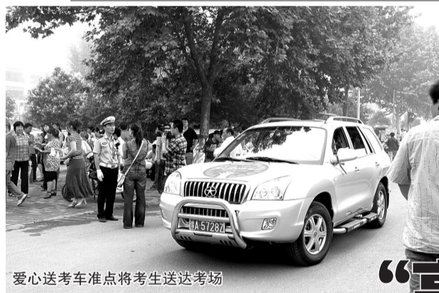
爱心送考车准点将考生送达考场

“我已经顺利完成接送考生的任务了,明年如果有这样的活动,我和同事一定还来参加。”