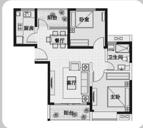
A-2 ( 89 平方米, 2 房 2 厅 1 卫 )

方正全明, 100% 超高实用率 南北通透, 空气流畅, 丰足采光 南北双阳台, 让绿氧与阳光一起穿堂而过 主卧飘窗收纳风景, 定格绿意盎然的园林风光 餐厅与客厅的有机相融, 动静分区优雅宜人