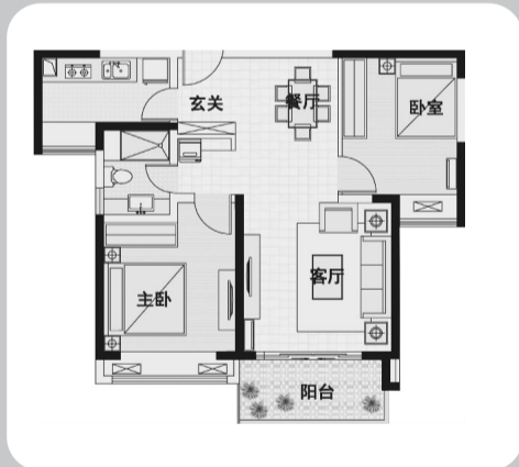
C-3 ( 115 平方米, 2 房 2 厅 1 卫 )

朝南户型, 格局方正, 实用紧凑 通透采光, 清风自由流动 厨房与餐厅守望相连, 美味生活充溢 客厅与主卧超大开间, 宽绰轩敞, 清新明亮 双卧均享观景大飘窗, 收纳风景, 定格绿意盎然的园林风光