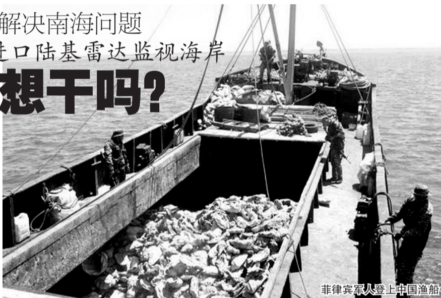
菲律宾军人登上中国渔船

五角大楼女发言人凯瑟琳在宣布这项决定时也强调,美方计划协助菲建立国家海岸监视中心,目前处于初步策划阶段,还没有定案,整个计划的成本和时间表也有待研究。