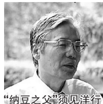
纳豆之父 郑重声明

旦血管再堵,还需做手术。昂贵的手术费不说,年龄大了手术的风险太大了。张大爷的大儿子持续关注了央视《每周质量报告》对清和雪的报道后,又进行了为期两周的明察暗访,确定清和雪非常适合老爷子的症状,一次性购买了10盒,张大爷服用一盒后,就感觉平时胸痛的现象消失了。服用4盒后,高压和低压不用其他药物维持居然正常了,精气神也十足了许多。服用一年后,去医院检查,曾经手术的主刀医生也很惊讶,说现在在老爷子的的心脏比手术前还好。全家人不用再担心让老爷子做危险而昂贵的心脏搭桥手术了。