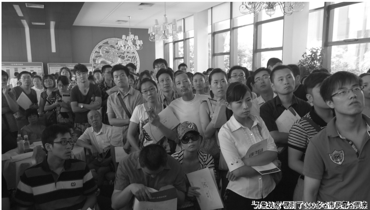
『为爱筑家』吸引了300多名市民慕名而来