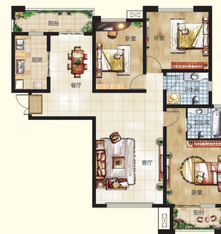
[ 140平米·完美三室 ]