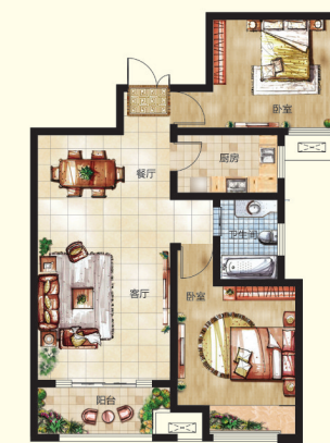
[ 88平米·精致两居 ]