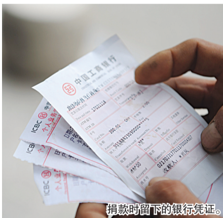
捐款时留下的银行凭证。