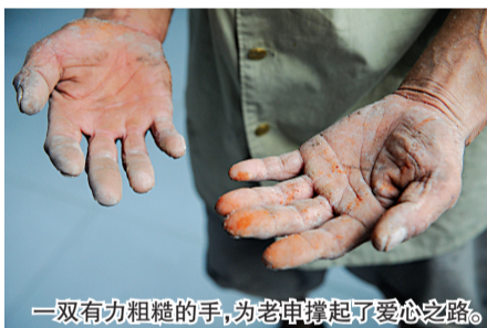
一双有力粗糙的手，为老申撑起了爱心之路。