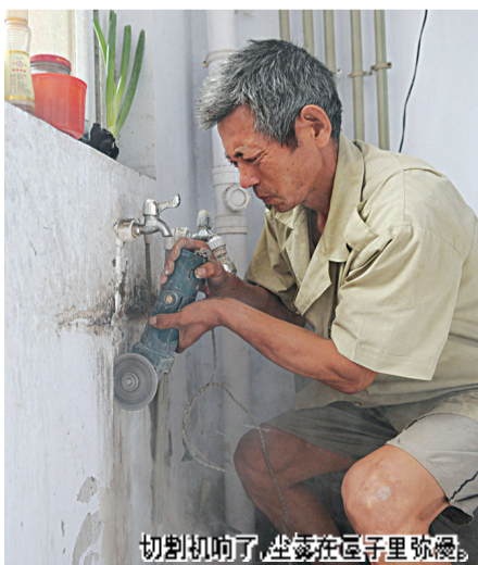
切割机响了，尘埃在空气里弥漫。