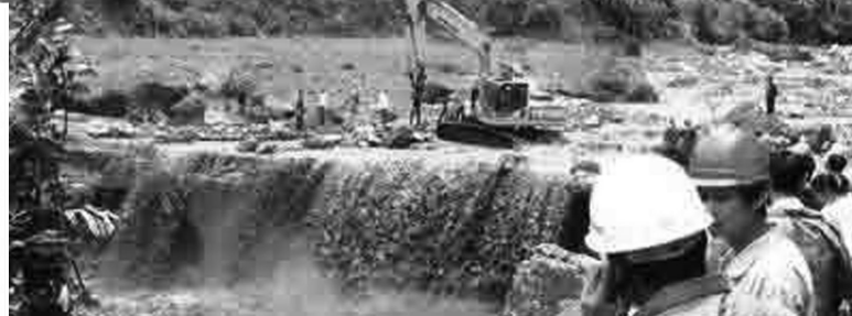
现场救援。据了解，挖掘机前面即是被泥石流冲毁的三层楼酒店。