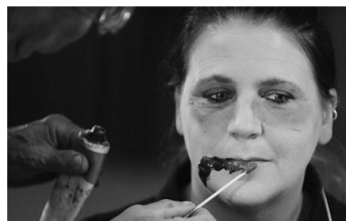
参加演习的人员都经过化妆,涂上假血,装成“僵尸”的样子。