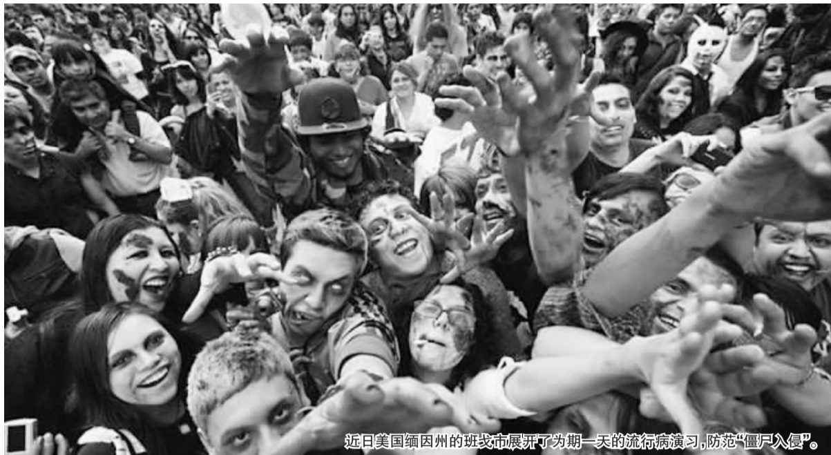
近日美国缅因州的班戈市展开了为期一天的流行病演习,防范“僵尸入侵”。