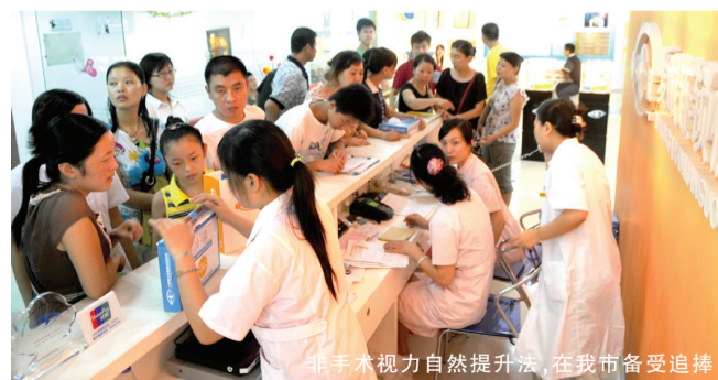
非手术视力自然提升法，在我市备受追捧

我国著名的视光专家彭运昌解释：视力=光+眼+脑。光是视觉的源泉，眼是视觉信息的容纳器，眼在大脑的控制指挥下实现视觉信号的收纳和传递，大脑是视觉系统的核心，是一切