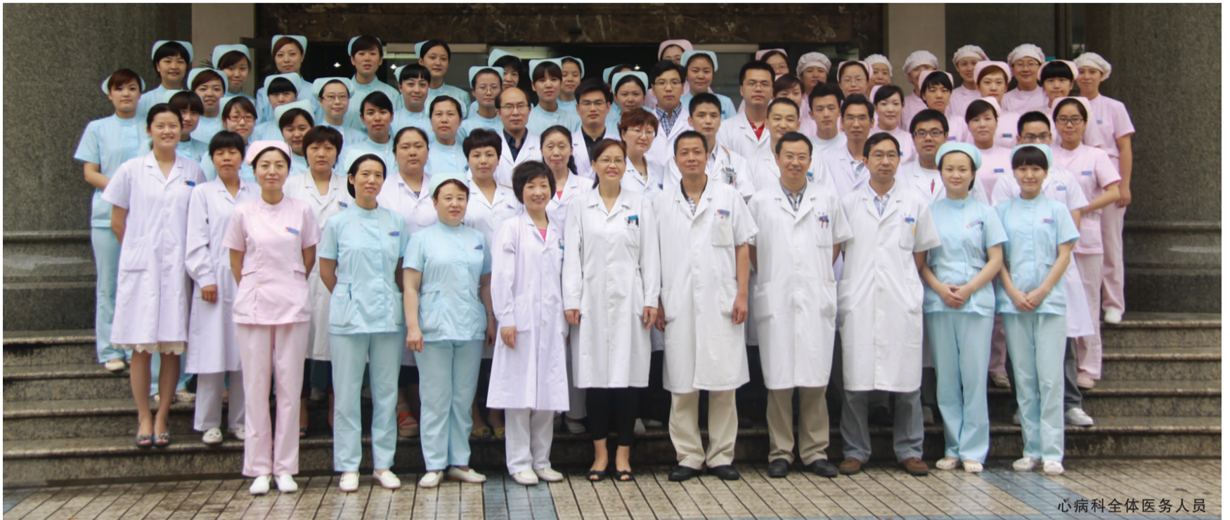
心病科全体医务人员