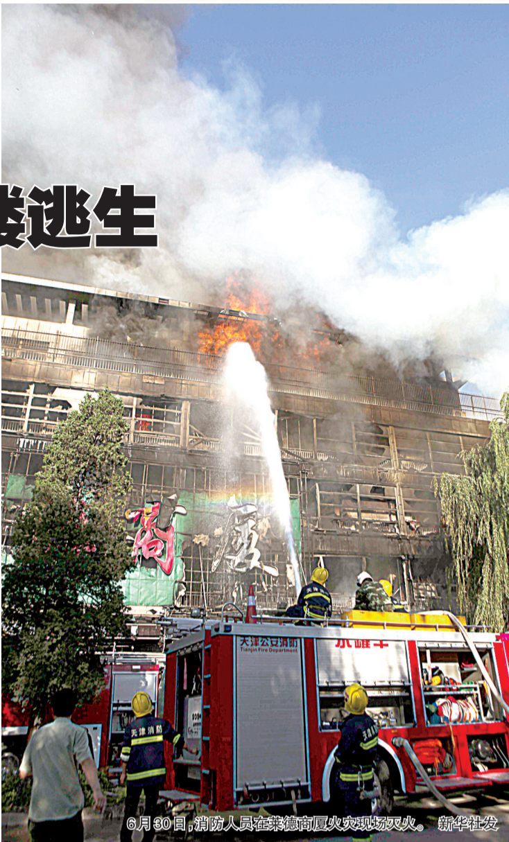
6月30日,消防人员在莱德商厦火灾现场灭火。