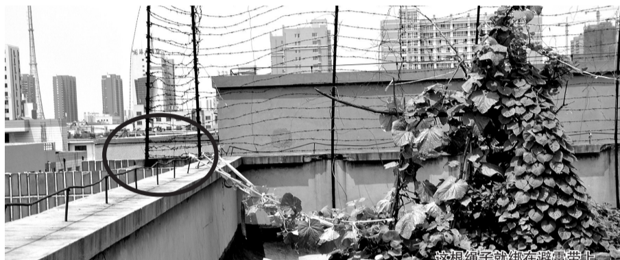
这根绳子就绑在避雷带上

省防雷中心工作人员表示,楼顶不允许种藤类植物,如果藤条缠绕到避雷带上,遇到雷雨天气会引起火灾等危险。