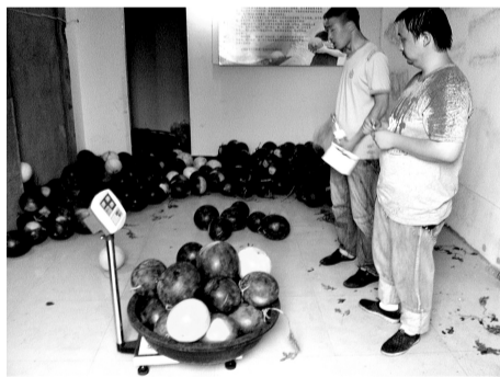
志愿者帮助“西瓜哥”称瓜