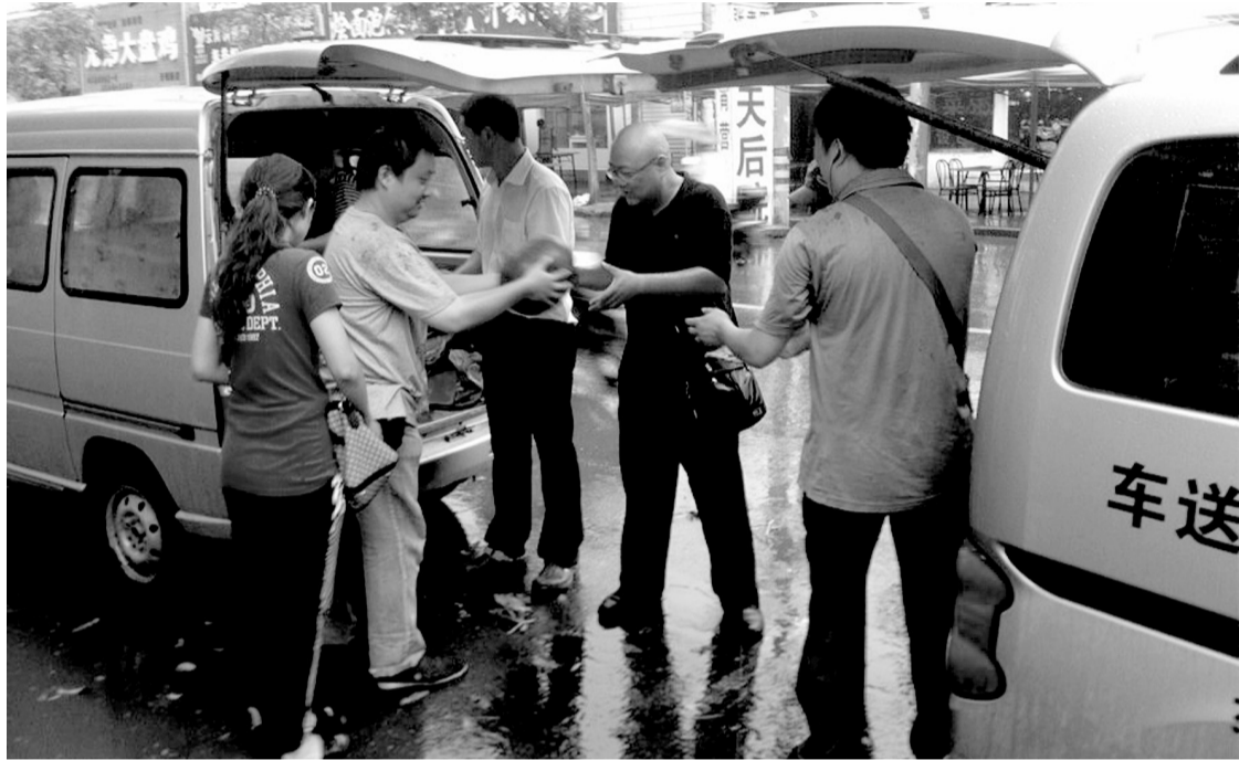
爱心市民正在冒雨买瓜