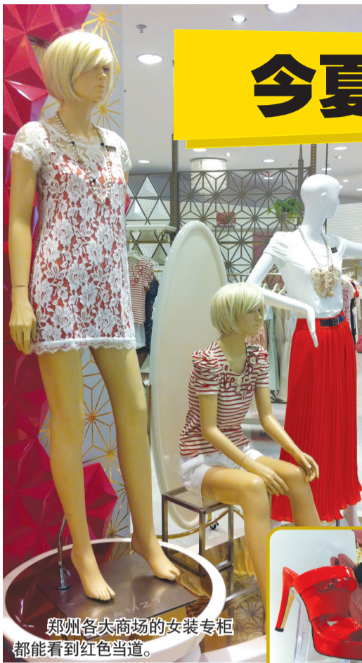
郑州各大商场的女装专柜都能看到红色当道。

7月3日,国际高端奢侈品牌香奈儿在巴黎举办2012~2013秋冬高级定制服发布会,其中国区形象大使周迅身着红色单肩裙装到场助阵。