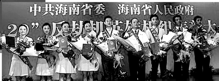
英雄机组全体成员

海南省委、省政府9日在海口举行大会,隆重表彰“6·29”反劫机英雄机组。海航集团对反劫机机组进行重奖。