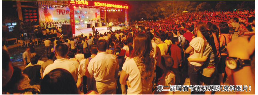
第二届啤酒节活动现场(资料图片)

盛夏将至, 城市热浪袭人, 处处令人压抑烦闷。来重渡沟吧, 这里竹影幽幽, 水声清越, 鸟语花香, 正是消暑、度假胜地。由栾川重渡沟风景区和郑州支点旅游品牌策划有限公司联合打造的“金星啤酒杯”重渡沟第二届山水狂欢节暨第四届音乐啤酒节周六将揭开神秘面纱。活动为期六周, 每周有惊喜, 场场有看点。