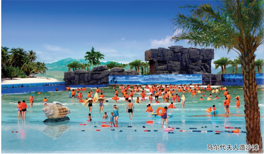
马尔代夫人造沙滩