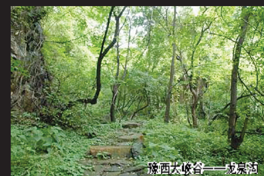
豫西大峡谷——成景园