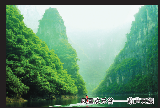
凤凰欢乐谷——葫芦天湖