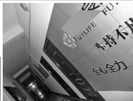
人气冷清,大门紧锁。