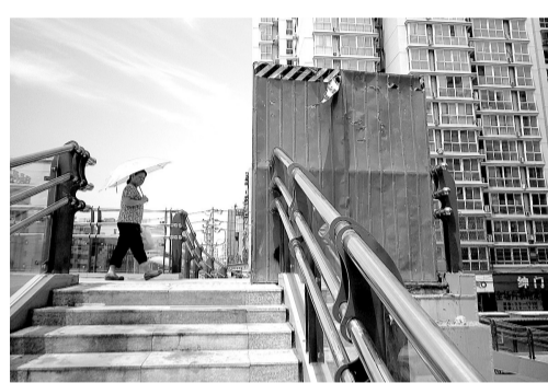
保全街天桥 施工挡板 代替护栏

记者昨天登桥发现,保全街天桥两端两处施工挡板尚未撤去。这两处施工挡板均紧挨上下桥通道,施工挡板填补代替的是钢化玻璃和不锈钢护栏。