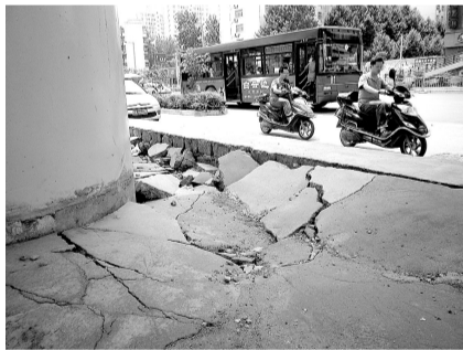
政通路天桥 多半地砖松动

过路老先生:两面玻璃坠落可能会出现伤害事故,希望有关部门上桥进行检查,尽快更换排除隐患。