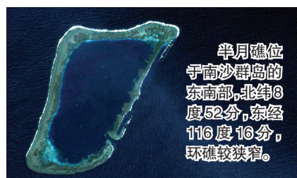
半月礁位于南沙群岛的东南部,北纬8度52分,东经116度16分,环礁较狭窄。

记者从国防部新闻事务局获悉,7月15日5时许,海军在南沙半月礁附近海域搁浅的护卫舰在救援兵力协助下自主脱浅成功,舰艇艏部轻度受损,人员安全,正在组织返港。事发海域未造成污染。