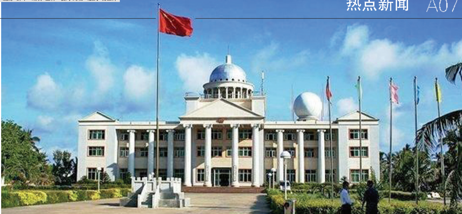
三沙市在永兴岛的办公楼

7月17日上午,海南省四届人大常委会第三十二次会议通过了《海南省人民代表大会常务委员会关于成立三沙市人民代表大会筹备组的决定》,标志着三沙市的政权组建正式启动。