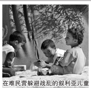
在难民营躲避战乱的叙利亚儿童