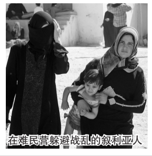
在难民营躲避战乱的叙利亚人