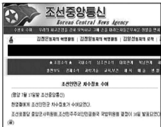
韩中社今晨发布消息的截图

此外，朝中社15日还刊发了前一天金正恩视察平壤市庆上幼儿园的报道。金正恩来到综合戏玩场、运动室、钢琴教室、戏水池等地观看孩子们的嬉戏和学习。综合新华社等