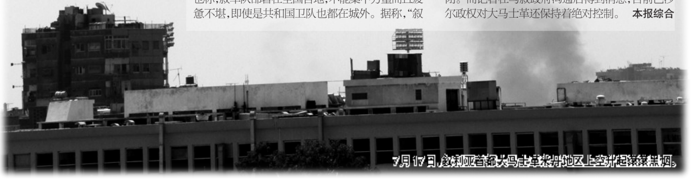
7月17日，叙利亚首都大马士革东部地区上空升起滚滚黑烟。