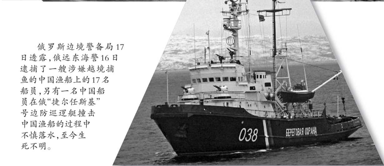
2009年开炮击沉中国货轮的俄罗斯海岸警卫队巡逻艇

俄罗斯边境警备局17日透露,俄远东海警16日逮捕了一艘涉嫌越境捕鱼的中国渔船上的17名船员,另有一名中国船员在俄“捷尔任斯基”号边防巡逻艇撞击中国渔船的过程中不慎落水,至今生死不明。