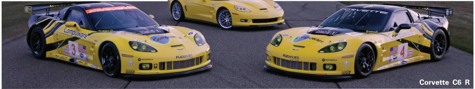
Corvette C6 R

以Corvette ZR1量产车改造而成的全新Corvette C6.R赛车,其特点在于车身紧凑,车长和车宽大约分别比现有车型C6减小了12.7厘米和2.54厘米。C6采用排量6升的V型8缸引擎,以通用Gen IV small block系列为原型,最大功率为298千瓦,最大扭矩为542牛·米。新款式采用了前灯不能缩回的非伸缩型设计,而1962年之后的克尔维特都采用了可回缩设计。引擎罩与现有车型一样,铰链设计在前面,但更小更轻。与现有车型相比,体积减小15%,重量减轻35%,而刚性却提高了40%。可拆卸的顶篷面板虽然加大了15%。