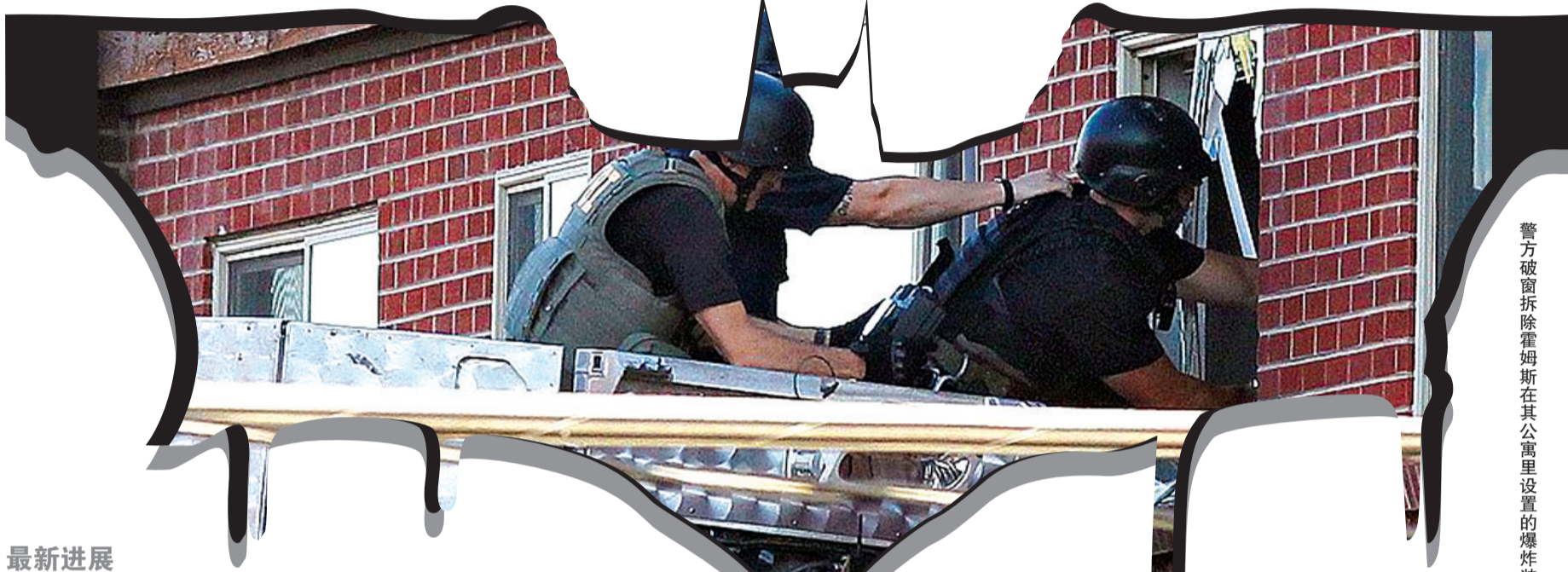
警方破窗拆除霍姆斯在其公寓里设置的爆炸装置。