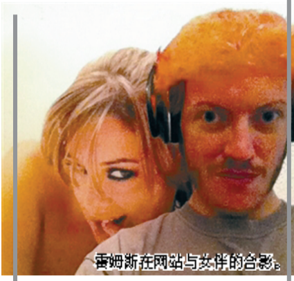
霍姆斯在网站与女伴的合影。