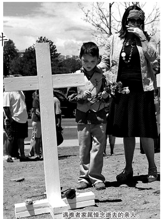
遇难者家属悼念逝去的亲人。