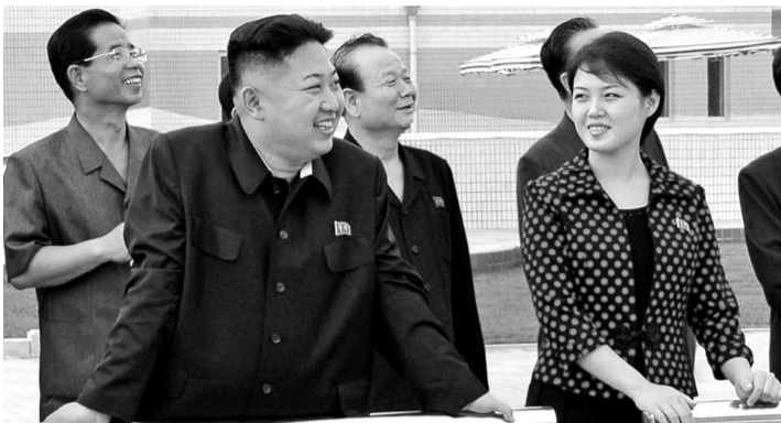
金正恩视察即将竣工的绛罗人民游乐园

本月7日,金正恩在观看牡丹坊乐团表演的时候,曾经有一位年轻的女士首次公开出现在了金正恩的身旁,这引发了各界的猜测,然后这位女士又在视察一所幼儿园时同金正恩一起出现,韩国媒体据此猜测,这位女士应该就是金正恩的夫人。尽管昨天的报道并没有直接出现金正恩夫人的画面,但是从近期陪同金正恩视察的女性当中,只有这一位女士多次出现的情况看,昨天的报道应该