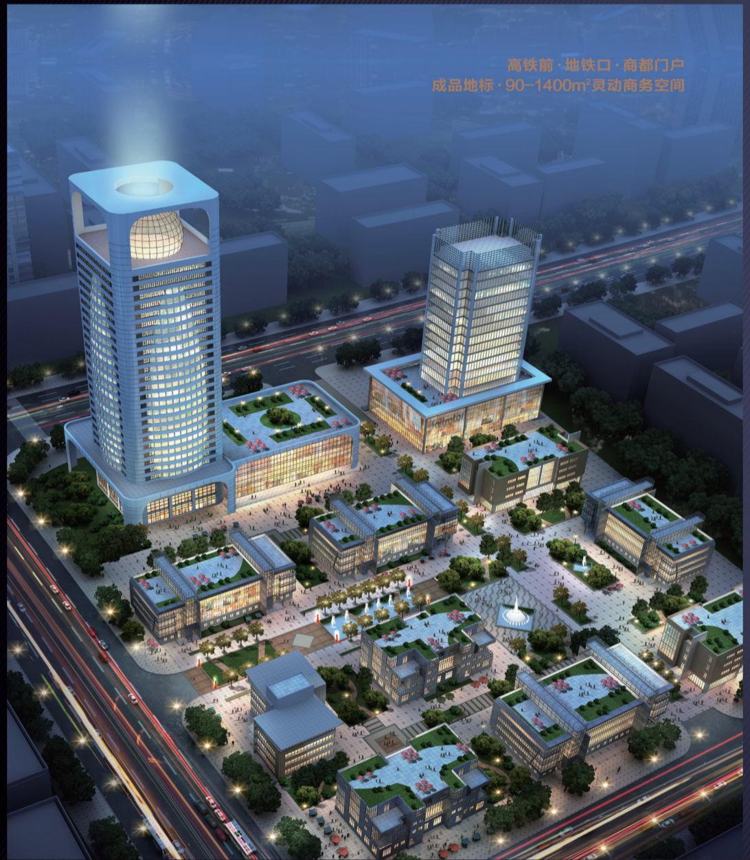
高铁前·地铁口·商都门户 成品地标·90-1400m 2 灵动商务空间

揽高铁商务区、产经大道、省府政务圈200亿金融力量， 尽数郑东CBD写字楼，性价比预想之外， 成长型企业迁徙至郑东高铁圈的最佳机遇， 优质写字楼“蓝筹股”：稀有，看得见！