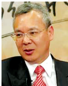
中国电子商会副秘书长