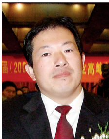
中国家电产业资深评论家

《郑州晚报·第一家电》一个传播中国家电业经济生活最前沿资讯的窗口；一座沟通品牌与消费者之间的桥梁；一个报风严谨、有着强烈社会责任感的的主流报媒；一个有着无限上升空间的开拓者；一个继往开来、全新起航的挑战者；一个敢于突破、不断否定旧我的创新者；一个绽放精彩、渐入佳境的专刊强者。