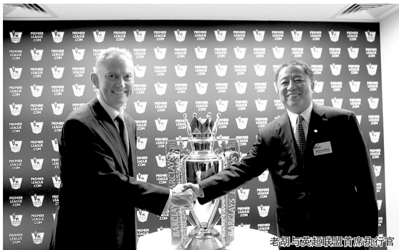
老胡与英超联盟首席执行官

与此同时，对于中国企业家们的访问，英国相关方面也给予了高度重视。英国首相卡梅伦在繁忙的奥运会开幕前筹备中，抽出时间与企业家代表沟通；剑桥大学、李约瑟研究院的专家学者与中国企业家展开思想的碰撞；劳斯莱斯、英国航空、ARM、巴宝莉、标准人寿、维珍集团等英国代表性企业的董事长及CEO均参与接待交流并带来了先进的企业管理理念。