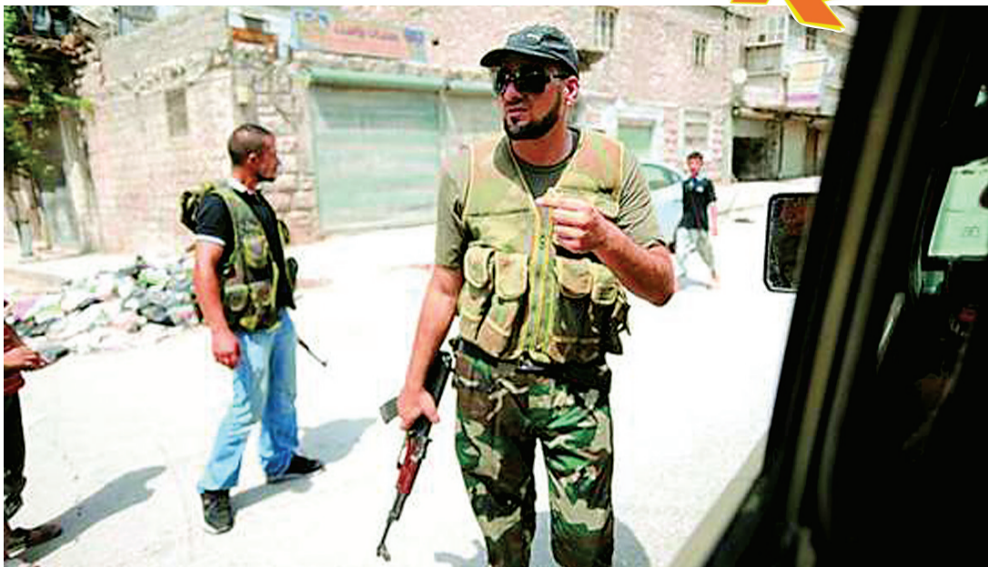
叙利亚叛军在阿勒颇附近巡逻。

美联社承认，反政府武装在叙利亚冲突中严重侵害人权的报告数量正在增加，令支持推翻叙利亚政府的西方国家难堪。