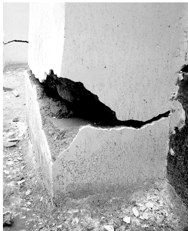
线索提供 赵忠豪(稿费50元)