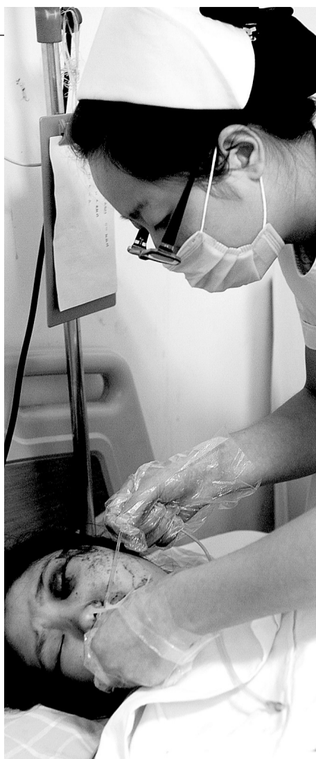
受伤女孩仍然神志不清,护士正给她戴吸氧管。