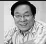
单国强 故宫博物院研究员、中国世鉴定委员会鉴定专家