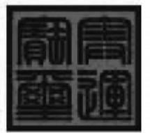
印面：9.5x9.5cm 寓意：九五之尊，象征奥林匹克运动无可比拟的世界地位；李劲松大师篆刻印文“奥运宝玺”。