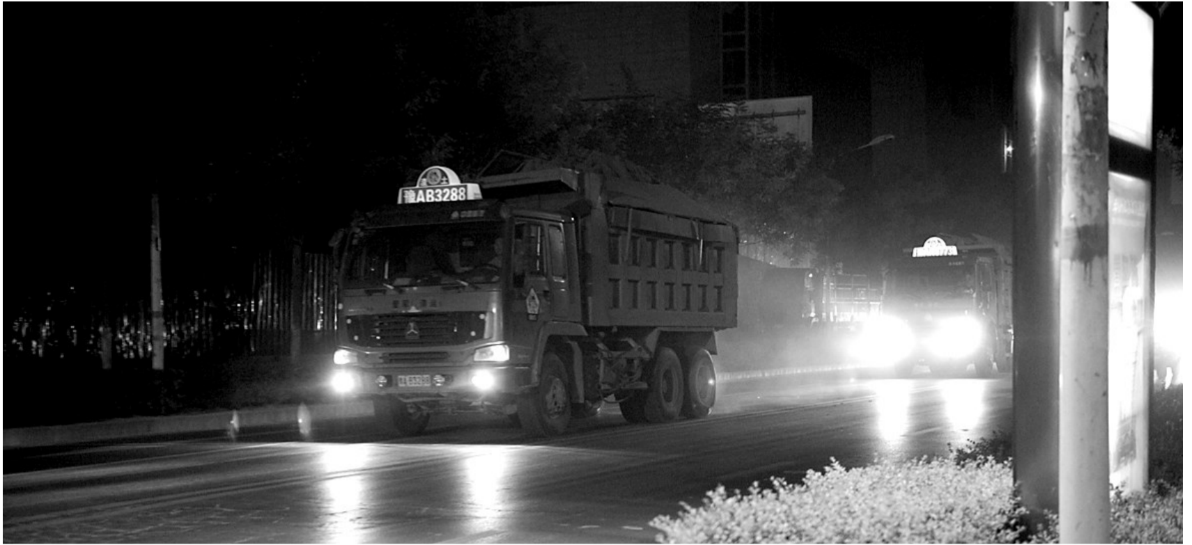
渣土车的车速太快了,记者等了半天才拍到两辆车在一个镜头里的画面。