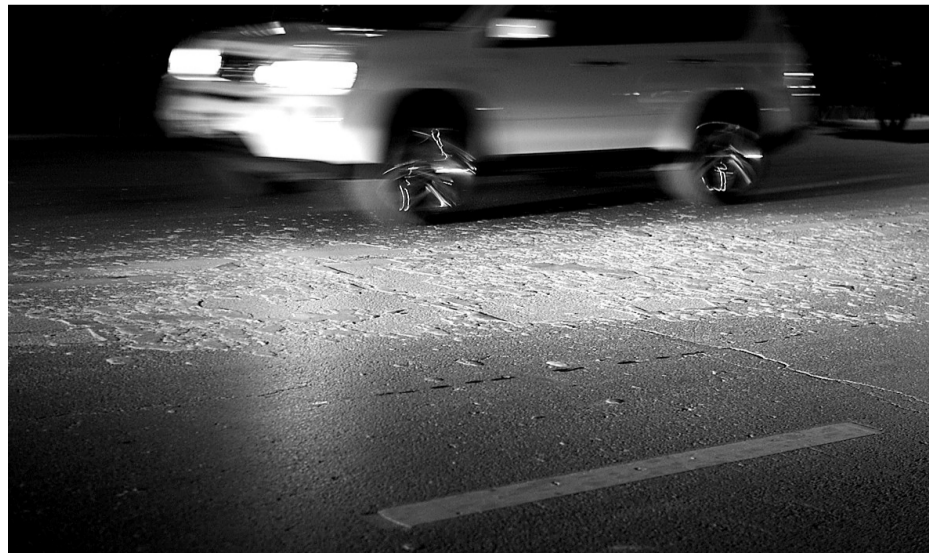
路面被轧得裂开了