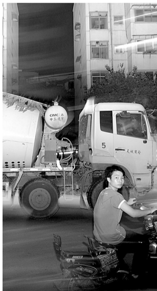
过马路时提心吊胆