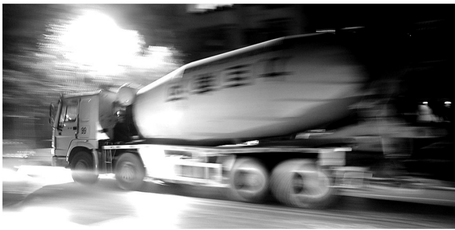
水泥罐车跑得非常快