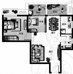
两居室 建筑面积约56平方米

56平方米精致个性两房,空间精致且功能分区合理舒适,南北通透,独立厨卫,动静分区,生活动线流畅、方便,餐厅、卧室独立私属的270°观景阳台,空间舒适不奢侈,专为都市精英打造。